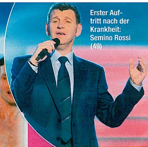
Erster Auftritt nach der Krankheit: Semino Rossi (49)